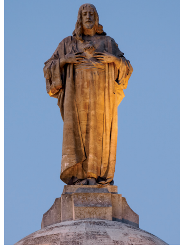
Sagrado Corazón de Jesús de la torre de la catedral de Valladolid

El Corazón de Cristo nos dice: “aprended de mí que soy manso y humilde de corazón y encontraréis vuestro descanso”. Venid a mí . Por eso el año jubilar debe de ser, un empeño de ayudar a los hermanos a encontrarse con el Señor . Encontrarse con el Señor en el Santuario o en la Catedral como templos jubilares. También, encontrarse con el Señor en cada una de nuestras comunidades. Encontrarse con el Señor, no sólo esperando a que las personas vengan al templo, sino yendo a visitar, dialogando, escuchando y anunciando. Vivimos, en este gran cambio, un cruce de caminos lleno de esperanza.